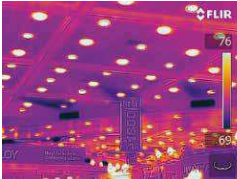
Le mode MSX® permet de voir plus de détails sur l'image thermique